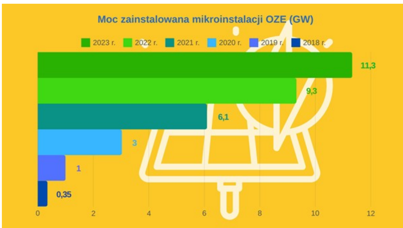
Rys. 2. Przyrost mocy zainstalowanej w mikroinstalacjach OZE w latach 2018-23 (GW).

W 2023 r. mikroinstalacje odnawialnych źródeł energii wprowadziły do sieci dystrybucyjnych ponad 7,3 TWh energii elektrycznej, a wyprodukowana energia niemal w całości pochodziła z promieniowania słonecznego (99,7 proc.). Blisko 98 proc. (7,1 TWh) wprowadzonej do sieci energii pochodziło z instalacji użytkowanych przez prosumentów.