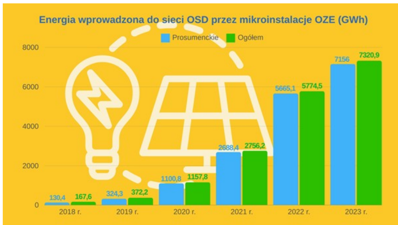
Rys. 3 Energia wprowadzona do sieci OSD przez mikroinstalacje OZE w latach 2018-23, w tym przez instalacje prosumenckie (GWh)

Na koniec 2023 r. ponad 2/3 mikroinstalacji prosumenckich (blisko 930 tys.) przyłączonych było do sieci dwóch operatorów: PGE Dystrybucja oraz Tauron Dystrybucja. Również do sieci tych OSD wprowadzono blisko 2/3 energii wyprodukowanej przez najmniejsze instalacje OZE.