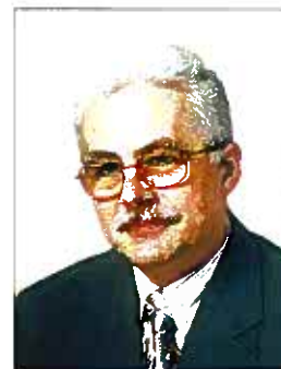
Autor pełni obowiązki dyrektora Departamentu Taryf URE

Z powyższych względów zaproponowany w przedmiotowej publikacji sposób uczestniczenia wnioskodawcy w inwestycji przyłączeniowej musi budzić fundamentalne zastrzeżenia i nie powinien być propagowany jako wzorzec zachowań w relacjach pomiędzy przedsiębiorstwem sieciowym i podmiotem wnioskującym o przyłączenie.