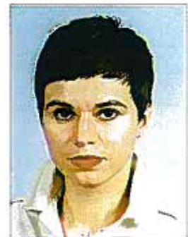
Autorka jest pracownikiem Biura Prawnego URE

Nie można było również zgodzić się z zarzutem powoda, iż ocena porównawcza nie jest miarodajna. Pozwany prezes URE jako regulator rynku ma z urzędu powszechny dostęp do danych cen i stawek opłat zawartych w taryfach przedstawianych do zatwierdzenia. Metoda porównawcza jest przesiewowym instrumentem badania rynku. Instrument ten rejestruje dysproporcje i jest często pierwszym sygnałem ewentualnych nieprawidłowości.”.