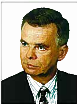
Autor jest naczelnikiem w Departamencie Przedsiębiorstw Energetycznych URE

Tekst stanowi wyraz osobistej wiedzy i poglądów autora i nie powinien być inaczej interpretowany.