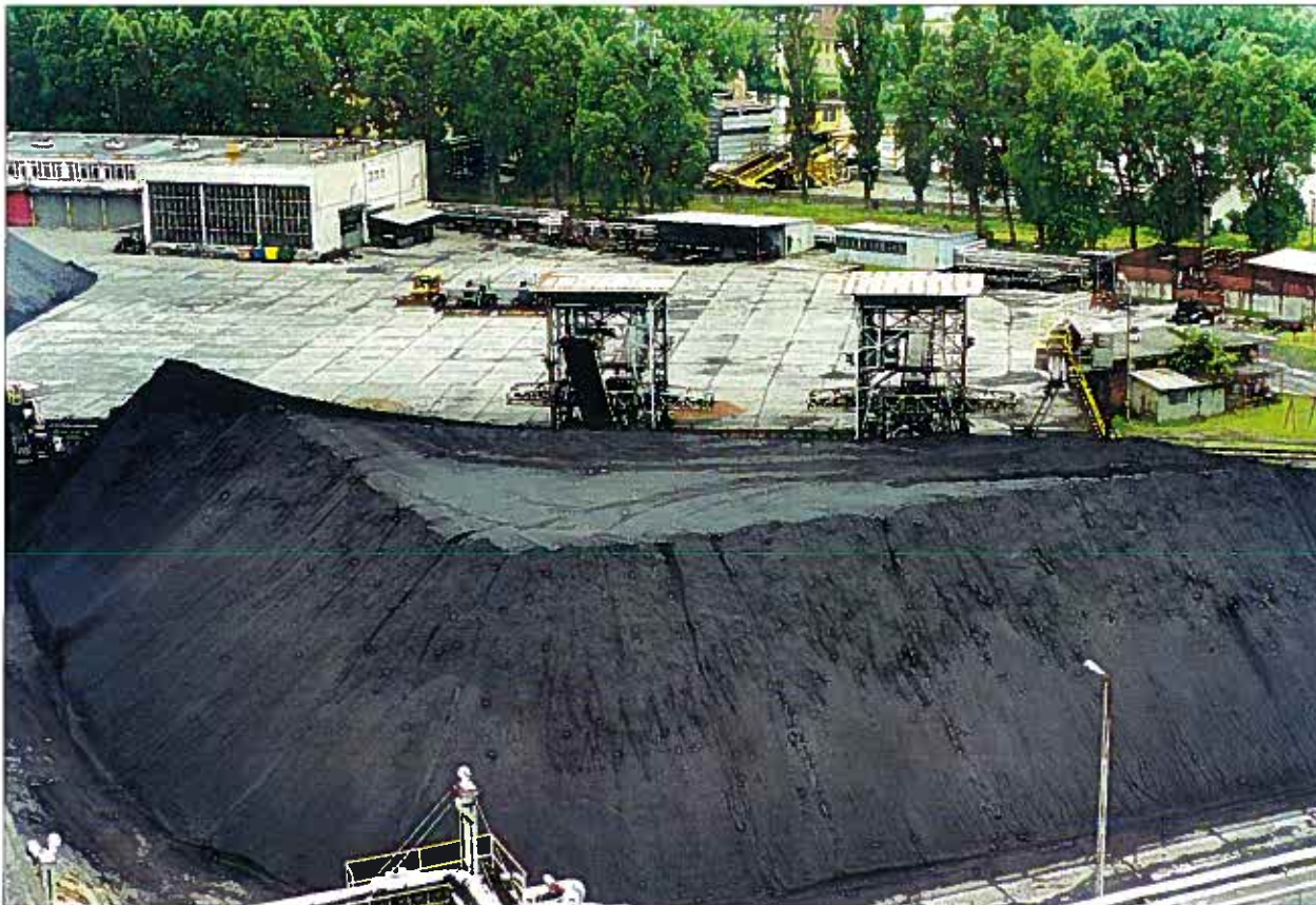
Składowisko węgla w EC Eiblag Sp. z o.o.

W ocenie Sądu zasadne było zatem zawieszenie postępowania do czasu rozstrzygnięcia sporu w zakresie stosunków własnościowych pomiędzy wspólnotą (powódka) a stroną zainteresowaną. Podzielić należało pogląd, iż rozstrzygnięcie w przedmiocie prawa własności węzła ciepłego ma wpływ na rozstrzygnięcie sporu w przedmiocie zmiany umowy sprzedaży ciepła – zmiany taryfy z T1 na T3.”