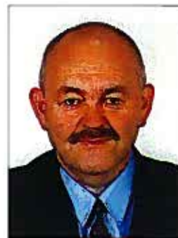
Autor jest doradcą Prezesa URE

VIII Forum Madryckie potwierdziło swą rolę jako miejsce ścierania się opinii i kształtowania wytycznych dla tworzenia ogólnoeuropejskiego rynku gazowego. Wydaje się jednak, zważywszy na dominację kontraktów długoterminowych oraz dominację silnych podmiotów zwłaszcza w przesyśle, że będzie to proces długotrwały, a efektywna konkurencja może zaistnieć tylko w skali europejskiej a nie wewnątrznarodowej.