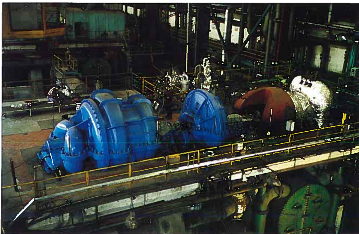
Turbosprężarka w Elektrociepłowni EC Nowa