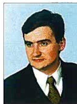
Autor jest pracownikiem Departamentu Promowania Konkurencji URE

Możliwość stosowania zabezpieczenia w postaci płaconych zaliczek nie wyłącza także możliwości stosowania art. 6a ustawy – Prawo energetyczne. Przepis ten, jako regulacja szczególna, może znaleźć zastosowanie niezależnie od systemu zabezpieczeń umowy na zasadach ogólnych. Ma on bowiem pewien charakter „represyjny”, związany z niewykonywaniem wcześniej zawartej umowy, natomiast przyjmowane przez Prezesa URE rozwiązanie (zaliczki) ma charakter gwarancyjny – zabezpieczający realizację orzekanej umowy. Tym samym przepis ten nie wyłącza stosowania powszechnych zabezpieczeń zawieranych umów cywilnoprawnych. Reguluje jedynie szczególny sposób wykonywania umowy, która wcześniej nie była przez odbiorcę realizowana. Natomiast wprowadzenie systemu zaliczek ma zagwarantować, aby sytuacja opisana w dyspozycji art. 6a ustawy – Prawo energetyczne nigdy się między stronami nie zrealizowała, tj. aby nie było pod rządami orzekanej umowy możliwości zalegania z opłatami dającymi podstawę do zainstalowania układu przedpłatowego.