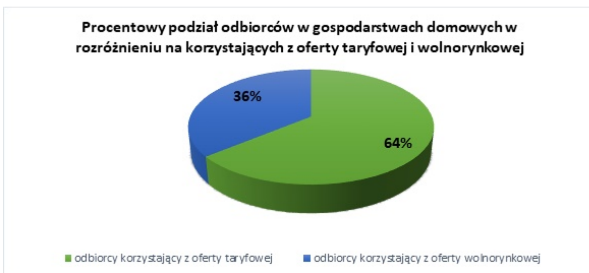
Rys. 2. Procentowy podział odbiorców energii elektrycznej w gospodarstwach domowych w rozróżnieniu na korzystających z oferty taryfowej i wolnorynkowej (stan na grudzień 2020)

Na koniec 2020 roku 9,8 mln odbiorców w gospodarstwach domowych korzystało z taryf zatwierdzanych przez Prezesa URE, natomiast 5,65 mln odbiorców korzystało z oferty pozataryfowej (wolnorynkowej). Oznacza to, że wolnorynkowe cenniki proponowane przez sprzedawców prądu miały zastosowanie do ponad 36 proc. odbiorców w gospodarstwach domowych.