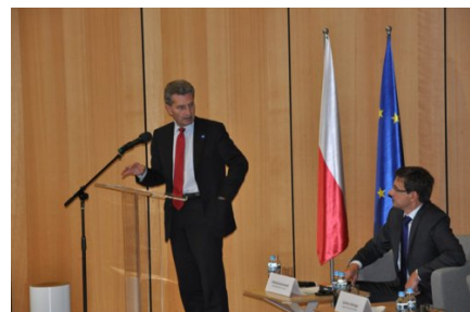
Günther Oettinger, Komisarz UE ds. Energii wygłasza słowo wstępne podczas otwarcia konferencji.